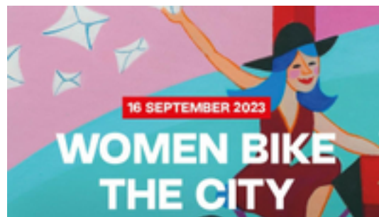
Afbeelding 1: Welkom - Women Bike the City @ Kortrijk

Vandaag doorkruis je Kortrijk. Je zal vijf kilometer